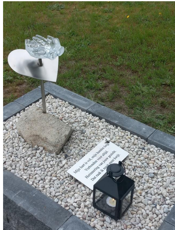
Het monument voor het stilgeboren kind

gesproken. Je moest weer door. Tegenwoordig is dat gelukkig heel anders. Er is op veel manieren begeleiding te vinden. Voor zowel de uitvaart als de rouwverwerking. Sinds 2019 is het mogelijk dat een stilgeboren kindje wordt geregistreerd. Dit kan zelfs met terugwerkende kracht. Het mag er zijn.